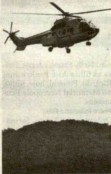
Movimentação militar continua

Durante a visita das autoridades à Base Aérea duas alternativas foram apontadas visando a obtenção dos cerca de R$ 7 milhões necessários para concluir essa primeira fase da transformação da Base Aérea de Santos em Aeroporto Civil Metropolitano.