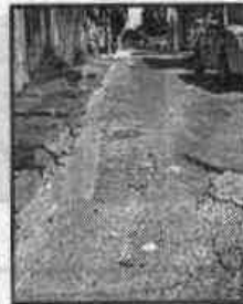
Rua Lisboa, em VC

quantidade de imperfeições e o tamanho delas aumentam devido ao trânsito de veículos e à força da água da chuva. "Moro aqui há 28 anos e o asfalto está cada vez pior".