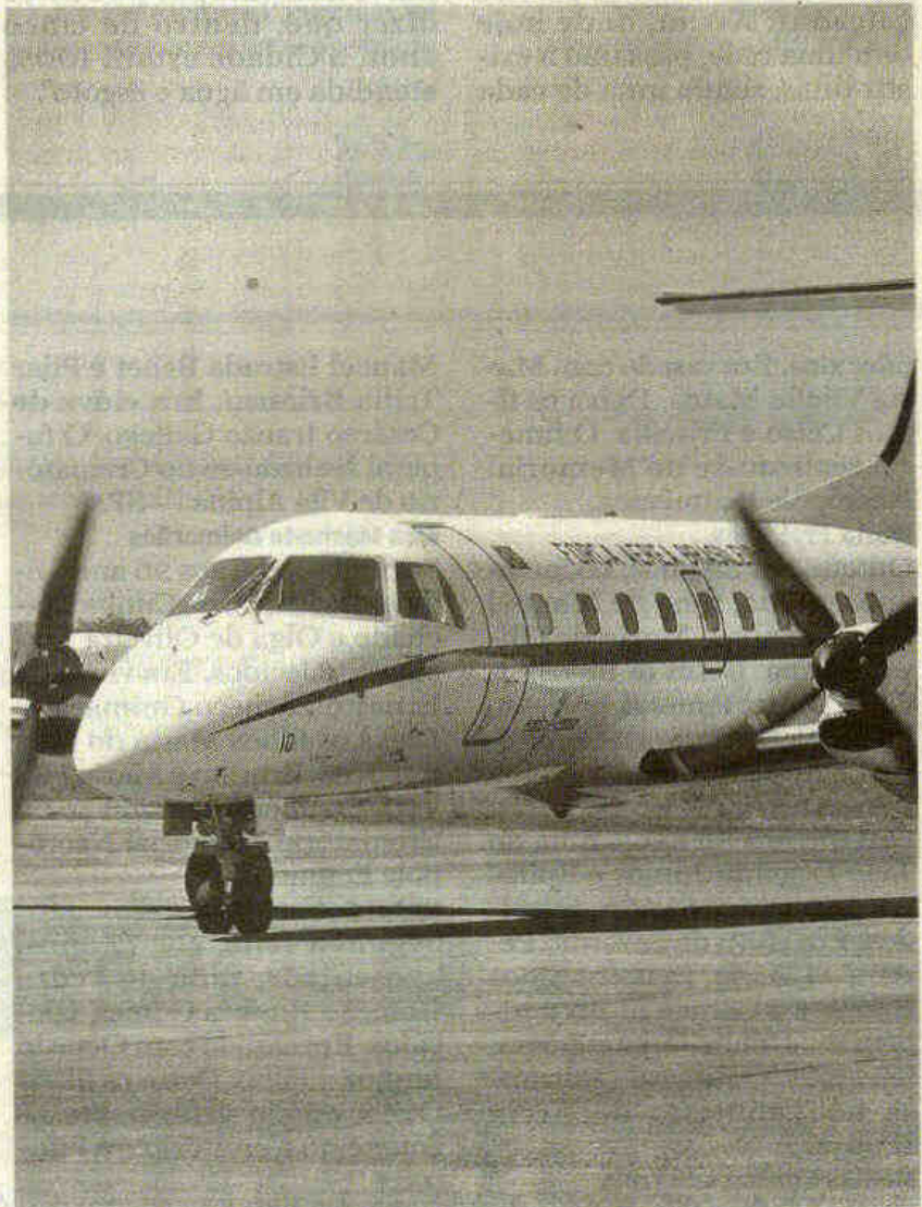
Uma aeronave da Força Aérea Brasileira pousou no início da manhã

de Marte fica na Zona Norte da Capital e é um dos mais movimentados do Brasil justamente por abrigar grande parte dos jatos executivos do País.