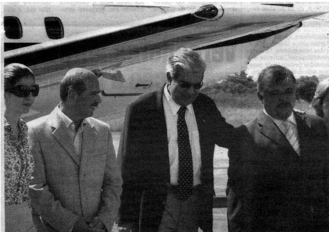
Em visita à Base Aérea, presidente da Infraero, Sérgio Gaudenzi, disse ter interesse em administrar o aeroporto

Em visita às futuras instalações do Aeroporto de Guarujá, o presidente da Infraero, Sérgio Gaudenzi, disse ter interesse em administrar o empreendimento. Na ocasião, deputados da Região anunciaram a liberação de R$ 10 milhões para as obras de infraestrutura inicial da pista de pouso. Gaudenzi sugeriu ainda a ampliação da capacidade operacional do Aeroporto de PG. Página 3